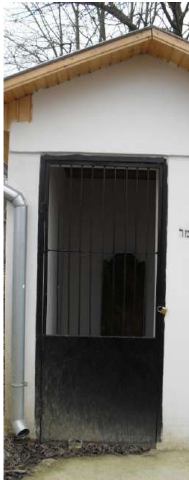
די אוהל פון הרה"ק רבי ברוך אברהם בינדיגער זי"ע אב"ד האנשאוויץ

ני"ו זאל שטייגן אזוי ווי זיין גרויסער זיידע דער צדיק הרה"ק ר' ברוך אברהם בינדיגער דער האנשאוויצער רב, און דער אויבערשטער זאל העלפן ביי ענק אלע אויף שמחות געזונטערהייט עמו"ש, בני חיי ומזוני רויחי, אונז באקומען נאך ביז היינט השפעות טובות אין זכות פון די הייליגע צדיקים, זאל קומען פאר אלע אידן גוטע השפעות, די שמחה זאל ברענגען נאך שמחות, אין די זכות פון די הייליגע צדיקים, זכותם יגן עלינו ועל כל ישראל, אמן. □