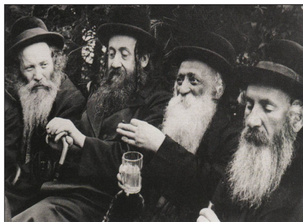
דער פראבואנט רב [מיט'ן גלעזל] אין מארינבאד

אויך האט ער דערציילט אז ער איז געווען מיט זיין טאטע, פון שבת פ' אמור ביז דינסטאג פ' בהר און ס'איז ביי אים געווען א גרויסע שמחה נאכדעם וואס ער איז שוין נישט געווען א לאנגע צייט בצל הקודש. און במשך פון די אלע טעג האט מרן מהר"ד זי"ע מיט אים געשמועסט יעדן טאג בדברי תורה, און געהאט א נחת רוח הערנדיג אז ער לערנט מיט זיינע תלמידים סדר קדשים, און מרן מהר"ד זי"ע האט אים געזאגט אז אויך ער