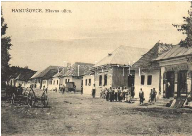
די פארצייטישע שטעטל האנשאווין אין סלאוואקיע