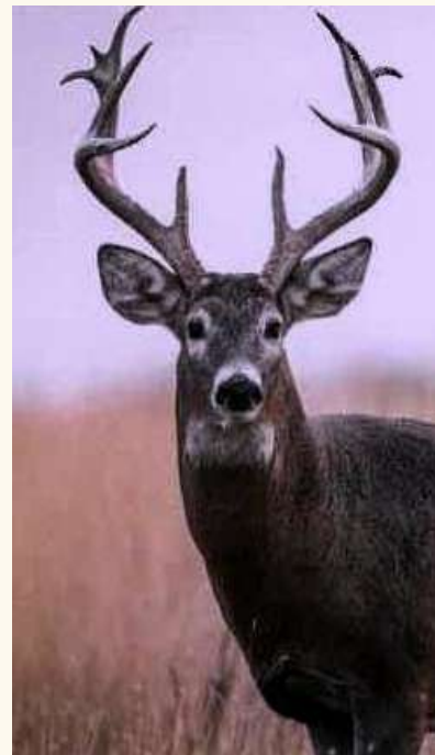
א הערש מיט זיינע הערנער וואס איז פון איין שטיק בייז, און איז פסול פאר תקיעת-שופר.

אהערשטעלן שופרות, וועט ער אים גערן אויסלערנען.