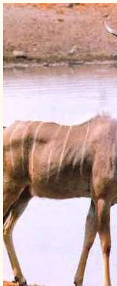
די 'קודר' חי' מיט זיינע לאנגע און געדרייטע הערנער וואס די תימן'ער אידן נוצן.