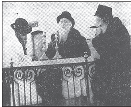
ביי א דרשה אין די שוהל אין פראבונא

ווען דער בילגורייא רב זי"ע איז א חתן געווארן בזיו"ש, מיט די רעבעצין, די מאמע פון כ"ק מרן אדמו"ר שליט"א האט מען געשמועסט איבערן יחוס פון די כלה, אלס אן אייניקל פונעם ערוגת הבושם ברודער, הגה"צ רבי יחזקי' זצ"ל. האט מרן מהר"ד זי"ע געזאגט בזה"ל: דער "ערוגת הבושם" איז געווען א תלמיד מובהק פונעם טאטן ז"ל [מרן מהר"ד זי"ע]. פונדעסטוועגן איז דער "ערוגת הבושם" פארעכנט געווארן ווי איינע פון די תלמידי הבעש"ט. ס'איז באוואוסט דאס דביקות פון "ערוגת הבושם" צו מרן מהר"ד זי"ע וואו ער איז געזיגן מיט גרויס הכנעה ווי א תלמיד לפני רבו, באימה וביראה ברתת ובזיע, ווייל ווער נאך איז געווען א מבין אויף די גרויסקייט פון מרן מהר"ד