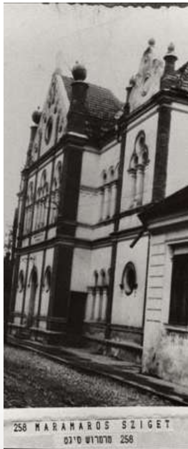
די ביהמ"ד אין סיגוט - אמאל

יבן דא ביים בית דין של מעלה, גסט עובר געווען אויף מיין זאג, "מוצא שפתוך תשמור", גסט נישט איינגעהאלטן וואס האסט צוגעזאגט, האסט גרשפארט די געשעפט שפעט כמיטאג! און מיין טאטע האט א אזוי אנגעהויבן צו שלעפן פון פלוצלינג זע איך מיך שטיין יבן ביים בית דין של מעלה.