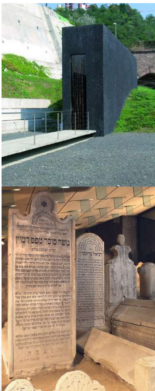
דער ציין פון הרב הגאון וקדוש בעל חתם סופר זי"ע אין פרעשבורג

פארזעצונג קומט אי"ה די קומענדיגע וואך. 7