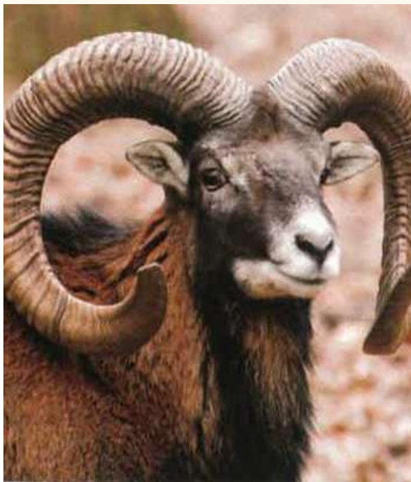
די געדרייטע הערנער, 'שופרות של איל', וואס איז מצוה מן המובהר צו נוצן.

צווישן די כשר'ע שופרות פון די קוען און שאף פאמיליע, זענען אויך פארהאן פארשידענע סארט הערנער וואס האבן קליינע אונטערשידן צווישן זיך. עס איז דא דער געדרייטער הארן פון די שאף און ציגן. דערנאך איז דא דער קורצער, שפיציגער הארן פון אקסן, ווי אויך זענען פארהאן די לאנגע, הערליכע הערנער וועלכע הייבן זיך ארויס פון דעם 'על' - דאס זענען אזעלכע גראדע הערנער, וואס מיר וועלן שפעטער באשרייבן.