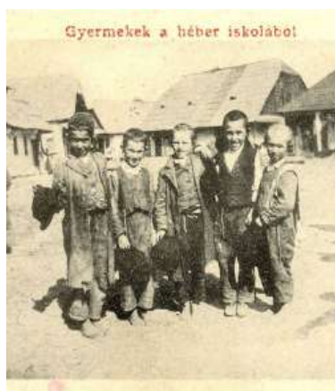
זיסע קינדערלעך אין שטעטל סיגוט

האט אים געמוזט ארויסטראגן מען האט אים צוביסלעך מונטערט צום צווייטן מאל, דער הייליגער ייטב לב האט אים פארברענגט נאכדעם א ערע צייט.