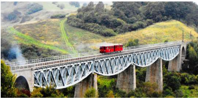
די באן אין האנשאווין