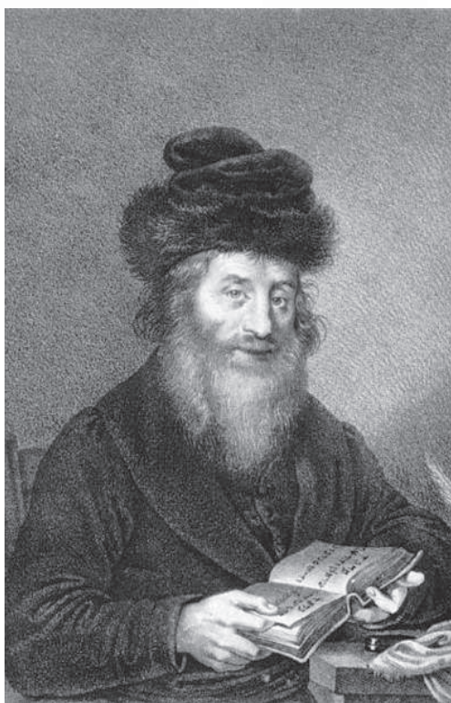
מורדכי הגדול הרה"ק רבי משה סופר זי"ע - פרעשבורגער רב - בעל חתם סופר

די מאמע די צדיקת איז אוודאי נישט געקומען צו די טמא'נע חתונה רחמנא ליצלן. זי איז געבליבן אינדערהיים, אויסגעוויינט איר הארץ און נאס געמאכט