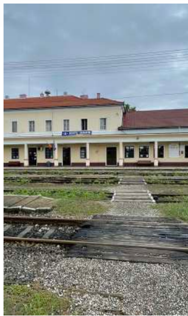
די באן סטאנציע אין סיגוט - ראמעניע

אפאר וואכן בין איך געגאנגען, און איך האב מיך נאכגעפרעגט ביז איך בין אנגעקומען דא אהער אין די שטאט סיגוט וואו איך האב דא געשריבן א קוויטל ווען איך בין אנגעקומען אין די שטאט מיינענדיג אז איך גיי דא זיין ביי דעם אייניקל פון דער רב און איך וועל מיר באדאנקען.