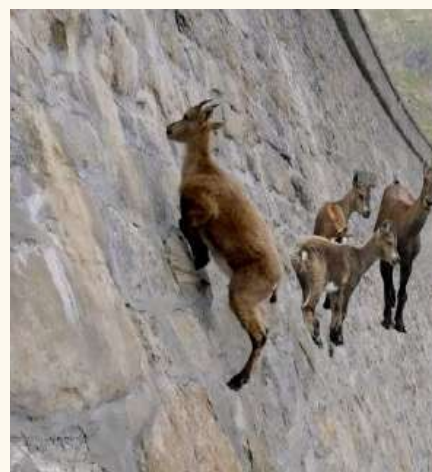
א גרופע שטיינבאקן קריכן אויף גראדע שטיינער ארויף א בארג.

עטליכע שיכטן איינס העכער דעם צווייטן. מיר פסק'ענען להלכה אזוי ווי די חכמים, אז מען טאר נישט נעמען א שופר פון א קוה.