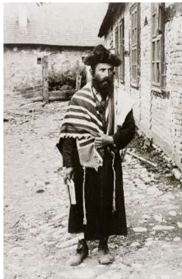
א איד מיט א הדרת פנים אין שטעטל סיגוט

אבער יענע פרייטאג צונאכטס ליג איך אין בעט און פלוצלינג זע איך מיין טאטע'ס צורה! עס האט מיר אזוי אויפגעשוידערט, עס האט מיר געכאפט אזא ציטער, מיין הארץ האט גענומען שטארק קלאפן. און איך הער ווי מיין טאטע זאגט: איך נעם דיר אויף א דין תורה