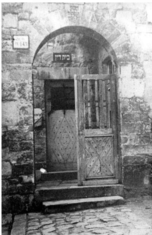
דער בית דין שטובל אין פרעשבורג

דער הייליגער חתם סופר איז געווארן אויפגעשוידערט אז אזא זאך האט פאסירט מיט א אידישער בחור'ל, און נאכדערצו זיינס א תלמיד. און נאכמער איז דער הייליגער חתם סופר געווען אינגאנצן צובראכן, ווייל ער האט גענומען אחריות אויף