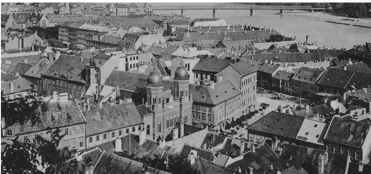
דער שטעטל פרעשבורג 100 יאר צוריק

געהיטן קיין איין מצוה זיכער נישט נעבער, גארנישט, ער איז געווען פריי רח"ל, חתונה געהאט מיט א גוי א טאכטער פון א גלח.