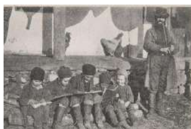
טייערע קינדערלעך אין שטעטל סיגוט לערנען פליסיג ביי זייער רבי'ן - די הינדלעך באמערקט מען טאנצן פון הינטער זיי...