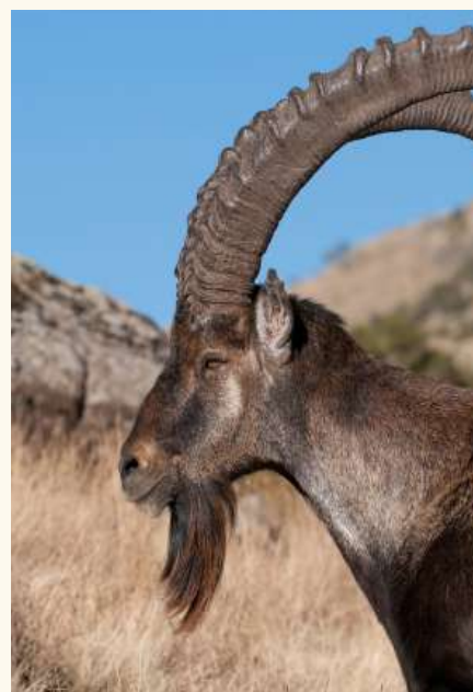
א 'יעל' (שטיינבאק). עס איז שטארק מערקבאר די רינגן אויף זיין געדרייטן הארן, וועלכע אנטוויקלן זיך לויט זיין שפיז.

אויף דער הארן פון דעם קוה איז פארהאן א מחלוקת אין די משנה (שם כ"ו) צווישן ר' יוסי און די חכמים אויב עס איז כשר פאר א שופר. די גמרא זאגט אז די הארן פון א קוה איז נישט כשר פאר א שופר, וויבאלד עס שטייט אין די תורה אז מען זאל נעמען איין שופר, און די הארן פון א קוה באשטייט פון עטליכע טיילן. דאס הייסט, עס איז צוזאמגעשטעלט פון