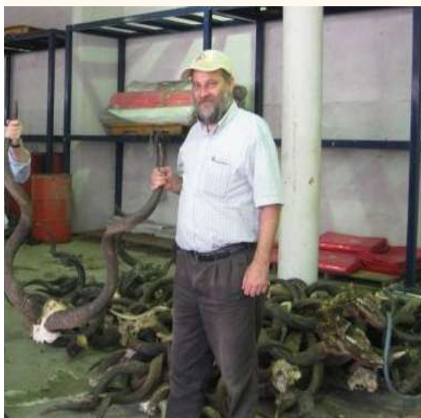
בילדער פון שופרות פאבריקן אין ארץ ישראל, וואו מען פאבריצירט פארשידענע סארט שופרות, אלע מאסן און נוסחאות, פארשידנארטיגע עדות און קהלות

פון די עלטערע רבנים פון ירושלים מיט צוויי יונגעלייט, און געבעטן א שופר. איינער פון די באגלייטער האט מיר ערקלערט, אז דער רב האט נישט קיין ציין און ס'איז אים שווער צו בלאזן. זיי האבן געזאגט אז זיי וועלן מיר באצאלן סיי וואס, אבי דער רב זאל קענען בלאזן.