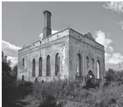
די חרוב'דיגע שוהל אין פראבוונא

אז ער דארף חזר”ק ”יורה דעה“, ביים ענדע זמן האב ער זיך פארהערט און באקומען סמיכה, און דער פראבוונא רב האט אים געזאגט: ”אזא סמיכה האב איך שוין לאנג ניש געגעבן“. ווען הרה”צ רבי וועלוועלע א זון פון הרה”ק רבי פינאעלע אוסטיאל זצ”ל איז געקומען זיך פארהערן צו באקומען סמיכה, איז ער פארבליבן אין פראבוונא פאר דריי טעג, און יעדן טאג האט אים דער פראבוונא רב פארהערט אלע חלקי הוראה, אהן קיין שום אויסנאם. אפילו ער איז געווען אן אייניקל פון מרן מהר”ד זי”ע, און ווען ער האט געזעהן ווי קלאהר ער איז בקי אין הוראה, האט ער אים געגעבן סמיכה. און ער האט ארויסגעוויזן זיין גרויסע שמחה אז ער האט געקענט פארהערן א בעלזער אייניקל און זעהן אז ער איז א תלמיד חכם מופלג און בקי בהוראה.