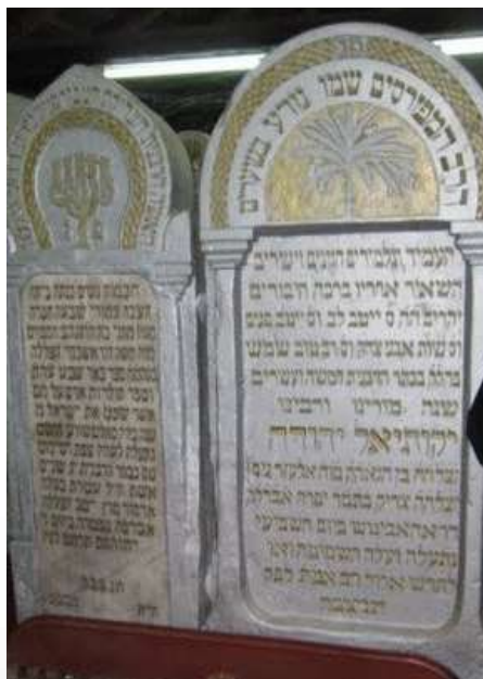
די ציון הקדוש פון הרה"ק בעל ייטב לב זי"ע - אין סיגוט