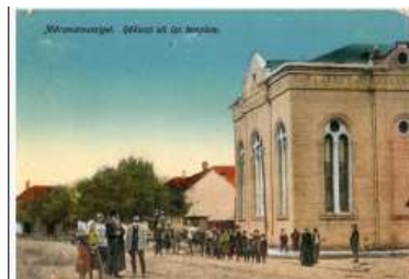
א ביהמ"ד אין סיגוט