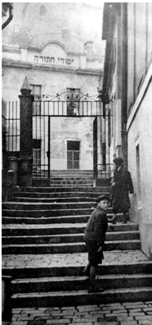
דער ת"ת "יסודי התורה" אין פרעשבורג